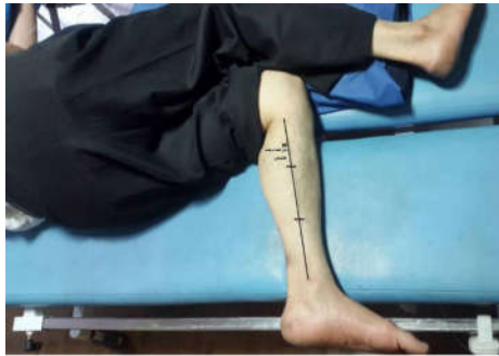
شکل ۲: روش تعیین نقطه سوزن زدن برای عضله خم کننده بلند انگشتان در وضعیت به پهلو خوابیده