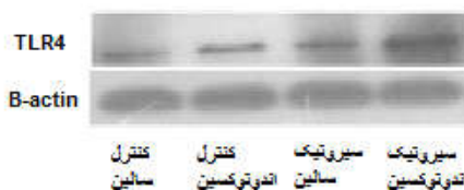
شکل ۲: تصویر وسترن بلات از بیان رسپتور TLR4 در کورتکس مغز در موش‌های صحرایی سالم یا مبتلا به سیروز تحت درمان نرمال سالمین و یا اندوتوکسین