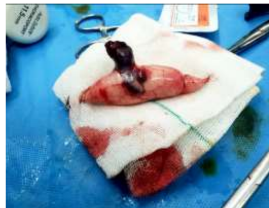
تصویر شماره ۳: رزکسیون wedge ضایعه عروقی