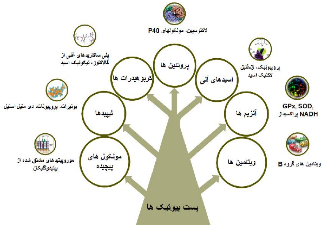
شکل ۱. انواع پست‌بیوتیک‌ها بر اساس نوع و ترکیب شیمیایی