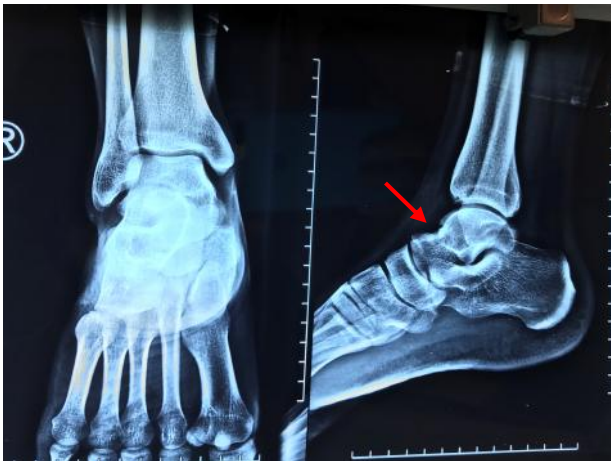
شکل ۶: رادیوگرافی بیمار بعد از عمل جراحی و بهبودی