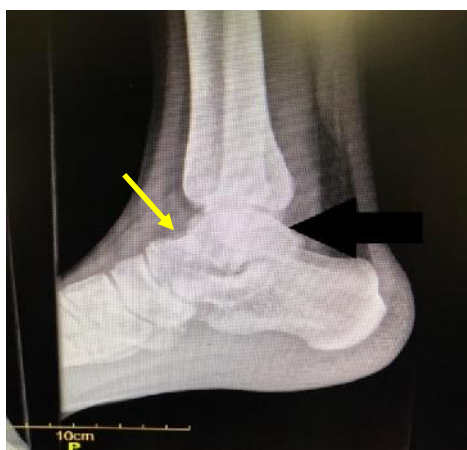
شکل ۱: محل ضایعه قبل از عمل در رادیوگرافی

خاصی نداشت و در معاینات بالینی، دورسی فلکشن و پلانٹارفلکشن کاهش پیدا کرده بود. آزمایشات خون طبیعی بود. در رادیوگرافی در قدام گردن تالوس توده گرد لوسنت با حاشیه اسکلوئوتیک رویت شد (شکل یک). در گزارش MRI بیمار توده ۹ میلی‌متری با ماهیت اسکلوئوتیک در گردن تالوس با حاشیه نازک لوسنسی در اطراف آن مشاهده شد (شکل ۲). کلیشه CT-Scan و گزارش آن نیز چنین توده‌ای را تایید نمود (شکل ۳).