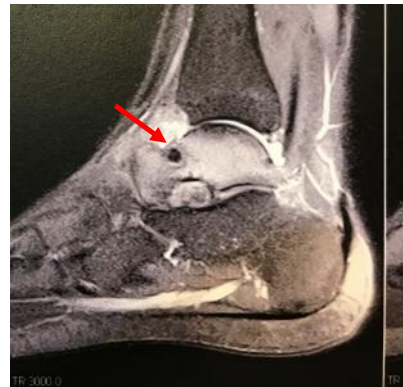
شکل ۲: محل ضایعه قبل از عمل در MRI

دراکسپلوراسیون توده ساب کورتیکال در گردن تالوس مشخص گردید که اکسیژون و کورتاژ حفره و نمونه برای بخش پاتولوژی ارسال شد. بیمار پس از ریکاوری به بخش فرستاده شد و با حال عمومی خوب مرخص گردید. در پیگیری های بعدی بیمار از درد یا علائم دیگری شکایتی نداشت و به روند طبیعی راه رفتن خود برگشت نمود. جواب پاتولوژی نیز مؤید تشخیص استئوئید استئوما بود.