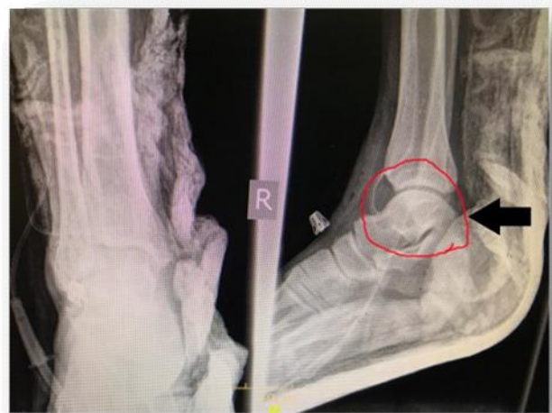
شکل ۴: محل ضایعه بعد از عمل در رادیوگرافی

محل ضایعه در رادیوگرافی بعد از عمل جراحی در شکل ۴