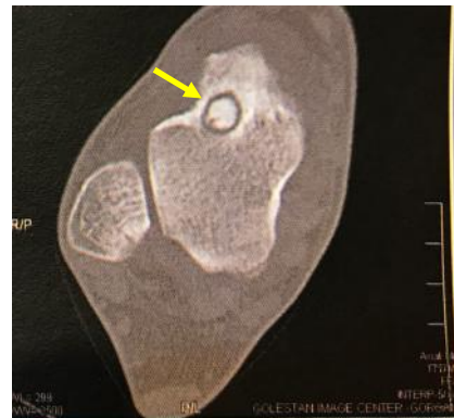
شکل ۳: محل ضایعه قبل از عمل در CT-Scan