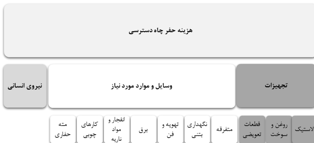
شکل ۱: هزینه حفر چاه دسترسی و زیر مجموعه‌های هزینه حفر چاه [۱۰]