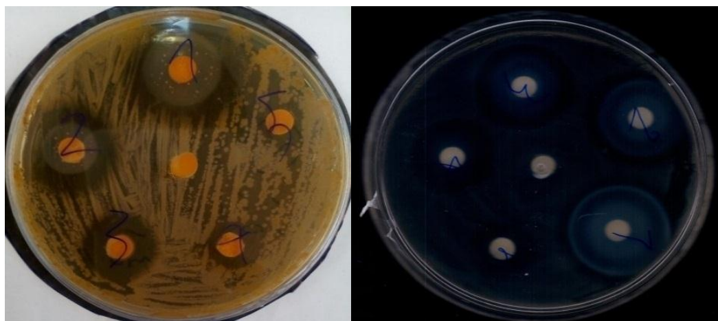
شکل شماره ۱: تست تعیین حساسیت با روش دیسک (شکل سمت راست باکتری اشرشیاکلی، شکل سمت چپ باکتری استرپتوکوکوس اینیایی)

شاهد: دیسک آغشته به آب مقطر، * (-): عدم مشاهده هاله، * حروف مختلف در ردیف‌های افقی، نشان‌دهنده وجود اختلاف معنی دار است ( p \leq 0.05 )