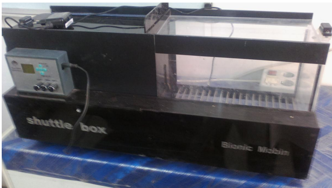
نمایی از دستگاه اجتنابی غیرفعال (Shuttel box)

در روز اول حیوانات به صورت دسته‌های ۴ تایی وارد محفظه مکعبی دستگاه شده و به مدت ۳ دقیقه با محیط داخل محفظه آشنا شدند. در روز دوم، موش‌های هرگروه به طور انفرادی روی سکوی داخل استوانه قرار گرفته و پس از ۱۰ ثانیه، استوانه به آرامی برداشته شد و زمان قدم‌گذاری موش از سکو به کف سیمی محفظه با کروномتر دقیقاً مورد سنجش قرار گرفت، سپس موش‌ها به قفس‌های خود برگردانده شدند. در روز سوم، موش‌های هرگروه به طور انفرادی روی سکوی داخل استوانه قرار گرفته و پس از ۱۰ ثانیه، استوانه به آرامی برداشته شد. پس از قدم‌گذاری حیوان به کف محفظه، شوک الکتریکی با ولتاژ خروجی متناوب ۶۰ ولت و شدت جریان ۱ آمپر برای مدت یک ثانیه از طریق