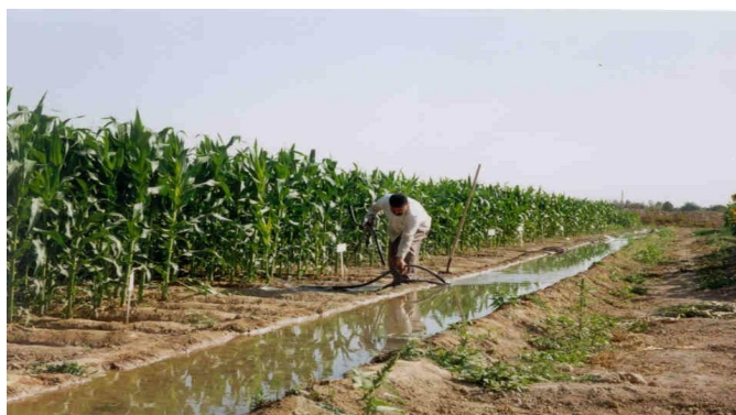
شکل 1- عملیات آبیاری ذرت دانه‌ای در مزرعه تحقیقاتی Fig. 1- Irrigation activity at maize research field