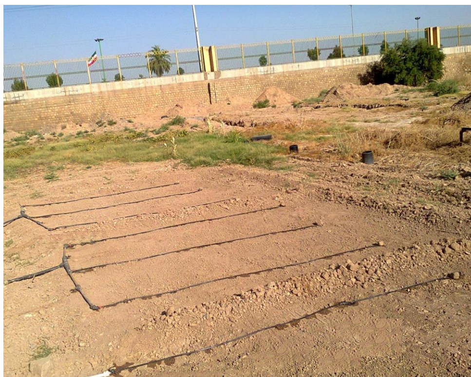
شکل ۲- آبیاری قطره‌ای - نواری در حال کار