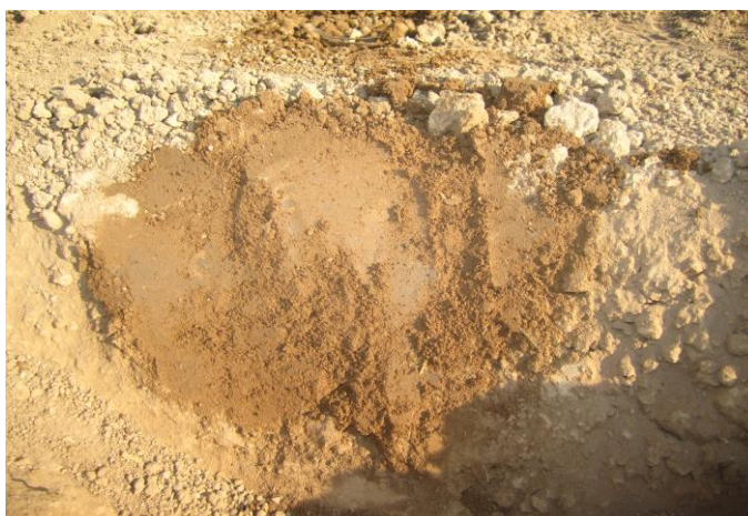
شکل ۳- پیشروی پیاز رطوبتی پس از ۲۴ ساعت