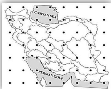
شکل (۱): حوضه‌های آبریز درجه ۲ و پراکنده‌گی داده‌های شبکه‌بندی شده ۲/۵ درجه (NCEP/NCAR)

محدوده مورد بررسی، کشور ایران است که وسعت آن در حدود ۱,۶۴۸,۰۰۰ کیلومتر مربع می‌باشد. مطابق تقسیمات سازمان تحقیقات منابع آب، کشور ایران دارای ۳۰ زیرحوضه هیدرولوژیکی درجه ۲ می‌باشد. تعداد زیرحوضه‌ها بیانگر تنوع آب و هوایی و اقلیمی این کشور می‌باشد. شکل شماره ۱ موقعیت زیرحوضه‌های درجه ۲ و همچنین پراکنش مکانی نقاط شبکه ۲/۵ درجه NCEP/NCAR را نشان می‌دهد. همان‌طور که مشاهده می‌شود برخی از زیر حوضه‌ها چند نقطه از شبکه را محصور نموده‌اند ولی در برخی دیگر حتی یک نقطه هم وجود ندارد.