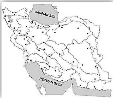
شکل (۳): پراکندگی ایستگاه‌های سینوپتیک مورد استفاده برای ارزیابی روشهای درون‌یابی