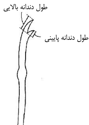
شکل ۱: محل اندازه‌گیری دندان سیتا

مقایسه میانگین‌ها از آزمون T-student برای دو نمونه مستقل استفاده شد. کلیه مقادیر میانگین به همراه انحراف معیار محاسبه شد.