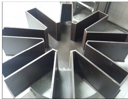
شکل ۱. دستگاه ماز شعاعی ۸ بازویی

آزمایش یادگیری و حافظه‌ی فضایی به روش ماز شعاعی: در ابتدا و پس از اتمام دوره‌ی آزمایش، وزن رت‌ها به دقت با استفاده از ترازوی دیجیتال (با دقت ۰/۰۰۱ گرم) توزین شد. به منظور سنجش آزمون یادگیری، از دستگاه رفتاری ماز شعاعی ۸ بازویی چوبی (شکل ۱) استفاده شد. این سیستم، شامل ۸ بازوی یکسان شعاعی است که از یک صفحه‌ی مرکزی کوچک دایره‌ای شکل منشعب می‌شوند. این طرح، تضمین می‌کند که بعد از این که حیوان برای یافتن غذا به انتهای یکی از بازوها می‌رود، برای این که به بازوی دیگر برود، مجبور است که به صفحه‌ی مرکزی برگردد. در نتیجه، حیوان همیشه ۸ گزینه‌ی ممکن را جهت حرکت دارد. در این سیستم، یک بازوی ثابت با یک ظرف مخفی همیشه محتوی غذا است. هنگام آزمون رفتاری، رفتار حیوان به وسیله‌ی یک دوربین دیجیتال که در بالای ماز شعاعی به سقف آزمایشگاه فیزیولوژی رفتاری نصب شده بود، فیلم‌برداری شد و پس از اتمام آزمون، فیلم به کامپیوتر منتقل و مشاهده و اطلاعات مورد نیاز یادداشت گردید.