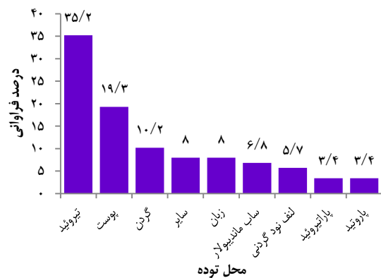
شکل ۱. درصد فراوانی محل توده‌های سر و گردن

گرفته بودند، وارد مطالعه شدند. میانگین سن این بیماران 49.2 \pm 18.8 سال با دامنه‌ی ۸۶-۱۳ سال بود. ۴۵ نفر (۵۱/۱ درصد) از بیماران مرد و ۴۳ نفر (۴۸/۹ درصد) زن بودند. میانگین سنی مردان و زنان به ترتیب 55.3 \pm 15.2 و 42.8 \pm 20.1 سال بود و مردان، به طور معنی‌دار از میانگین سنی بالاتری برخوردار بودند ( P = 0.001 ). شایع‌ترین تومورهای ناحیه‌ی سر و گردن در بیماران مورد مطالعه، تیروئید با فراوانی ۳۱ مورد (۳۵/۲ درصد) و توده‌های پوستی با فراوانی ۱۷ مورد (۱۹/۳ درصد) بود (شکل ۱).