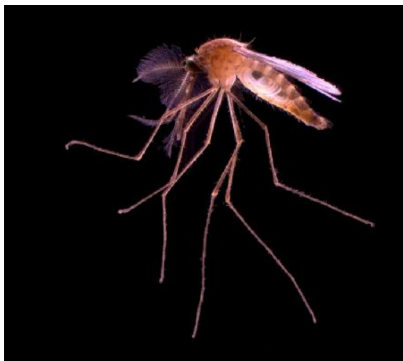
شکل ۲- پشه Culex pipiens pipiens آلوده به نماتود Strelkovimermis spiculatus Fig. 2. Culex pipiens pipiens mosquito infected by the nematode Strelkovimermis spiculatus

راند و پس از مدتی پیش‌انگل‌ها تمایلی به آلوده‌سازی پشه نشان ندادند. تصور می‌شود خودداری پیش‌انگل‌ها از آلوده سازی لاروهای سنین بالاتر پشه فقط مربوط به سختی و غیرقابل نفوذی کوتیکول آنها نیست بلکه لاروهای سنین بالا رفتارهای دفاعی قوی‌تری نیز دارند. بنابراین محصور ساختن لارو در یک قطره کوچک آب که حرکات لارو پشه را محدود کند نفوذ پیش‌انگل‌ها را تسهیل می‌سازد. همچنین آلوده‌سازی جداگانه و انفرادی لاروها با تعداد محدودی از پیش‌انگل‌ها در مقابل آلوده‌سازی دسته‌جمعی آنها در ۲۵۰ میلی‌لیتر سوسپانسیون، علاوه بر این که حرکات دفاعی لارو در مقابله با نفوذ نماتودها را کاهش می‌دهد بلکه مانع از بارگذاری (overload) بیش از حد نماتودها در لاروها می‌شود که برای بقای لارو ضروری است.