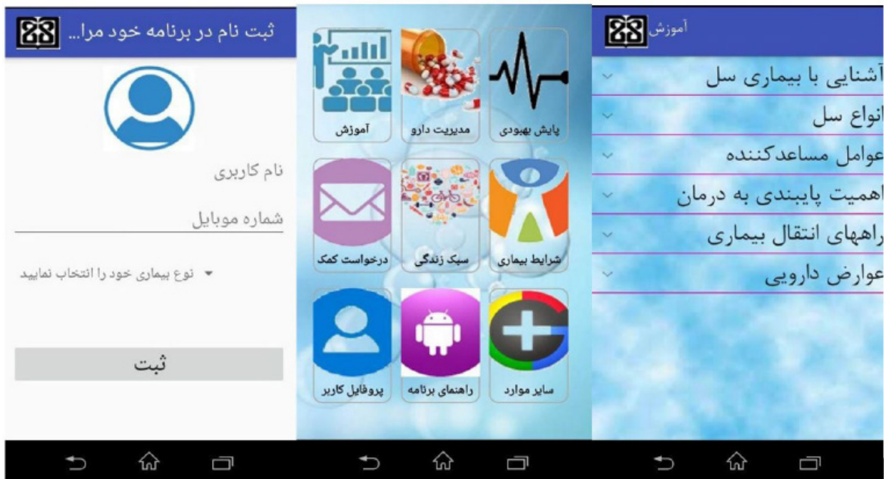
شکل ۲: نمایش بخش هایی از اپلیکیشن TBMed

از آنجا که در مطالعه کنونی، هدف از ارزیابی، صرفا