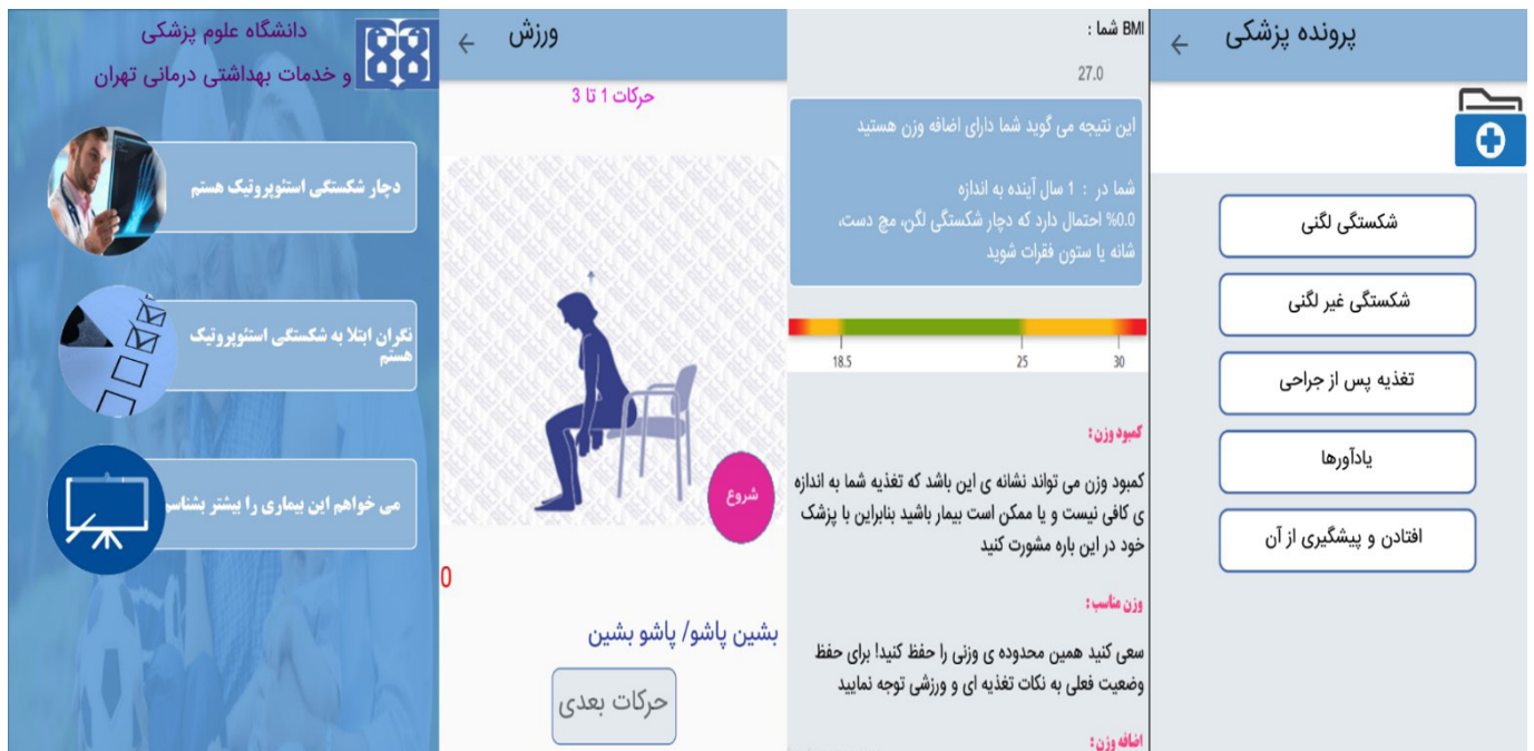
شکل ۲: تصاویر صفحات برنامه‌ی کاربردی مراقبت شکستگی‌های استئوپروتیک

۸۶٪ و بر طبق مطالعات در تشخیص شکستگی‌ها به‌خصوص شکستگی‌های لگن از ابزار FRAX دقیق‌تر است (۴۴). این قسمت نیز با عنوان «نگران مبتلا به شکستگی می‌باشم» در برنامه نمایش داده می‌شود. در انتها عنوان «مبتلا به شکستگی استئوپروتیک هستم» برای مدیریت مراقبت بیماری در افرادی است که در حال حاضر دچار شکستگی استئوپروتیک هستند که علاوه بر رایه‌ی اطلاعات، دارای دو بخش تنظیم یادآور و نیز تهیه پرونده‌ی پزشکی است. ایجاد برنامه به زبان جاوا بوده است. در بخش ارزیابی، الگوریتم ابزار معتبر ارزیابی خطر شکستگی Qfracture (۴۵) که تحت لیسانس سومین ورژن GNU Affero General public License بوده و بنابراین منبع باز محسوب می‌شود از زبان سی به زبان جاوای سازگار با اندروید برگردان شده و در قالب برنامه‌ی کاربردی استفاده گردید. شکل زیر نمونه‌ای از صفحات برنامه کاربردی خودمدیریتی در شکستگی‌های استئوپروتیک را نشان می‌دهد. کاربر در بخش اول می‌تواند از اطلاعاتی درباره‌ی معرفی بیماری، گروه‌های در معرض خطر، تغذیه، ورزش و نیز راه‌های تشخیص و درمان بیماری و اطلاعات راجع به خطر افتادن و روش‌های پیشگیری از آن استفاده نماید. در بخش دوم، پرسش‌نامه‌ای شامل مجموعه‌ای از عوامل خطر آورده شده در