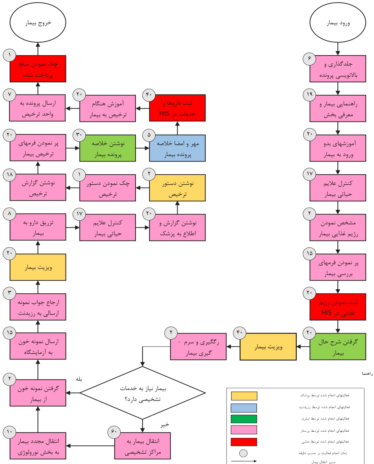
نمودار ۱: فرایند درمان بیماران نورولوژی اطفال