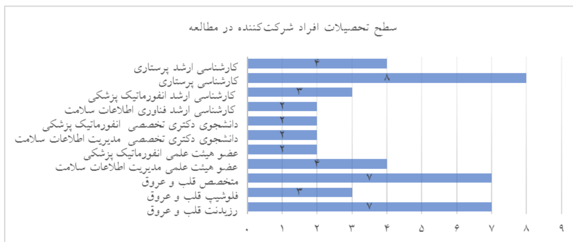
شکل ۲: نمودار سطح تحصیلات افراد شرکت‌کننده در این مطالعه به تفکیک تخصص و فراوانی

در مجموع ۴۴ نفر در این مطالعه شرکت کردند که ۴۷/۷٪ خانم بودند و میانگین سنی کل شرکت‌کنندگان تقریباً ۳۷ سال بود. ۱۷ پزشک، ۱۲ پرستار و ۱۵ نفر از رشته‌های مدیریت اطلاعات سلامت و انفورماتیک پزشکی بودند.