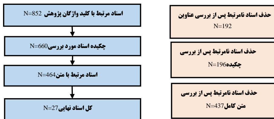
شکل 1. نمودار چارت روند نما

گرفتند. در گام اول عناوین مورد بررسی دقیق قرار گرفتند و اسنادی که بی‌ارتباط با موضوع و کلیدواژگان پژوهش بودند و نیز با عناوین و اهداف یکسان انجام شده بودند از سبد پژوهش حذف شدند. در گام بعدی اسناد باقیمانده از نظر چکیده مورد بررسی قرار گرفتند تا مشخص شود در ساختار چکیده آن‌ها نتایج به خوبی گزارش داده شده‌اند و در برگیرنده حوزه مورد نظر پژوهشند. در این گام نیز اسنادی که اطلاعات کافی در زمینه اهداف مورد نظر پژوهش (که همان شناسایی مؤلفه‌های ویژگی محور و مهارت محور رهبری کارآفرینانه می‌باشد) را گزارش نداده بودند، حذف شدند. در گام پایانی نیز اسناد باقیمانده از نظر محتوا و ساختار مورد بررسی قرار گرفتند و اسنادی که فاقد الگوی روش شناختی مناسب و کیفیت لازم علمی بودند، از سبد تحقیق حذف شدند. نمودار روندنمای پژوهش حاضر بر اساس ملاک‌های ورود و خروج در شکل 1 نشان داده شده است.