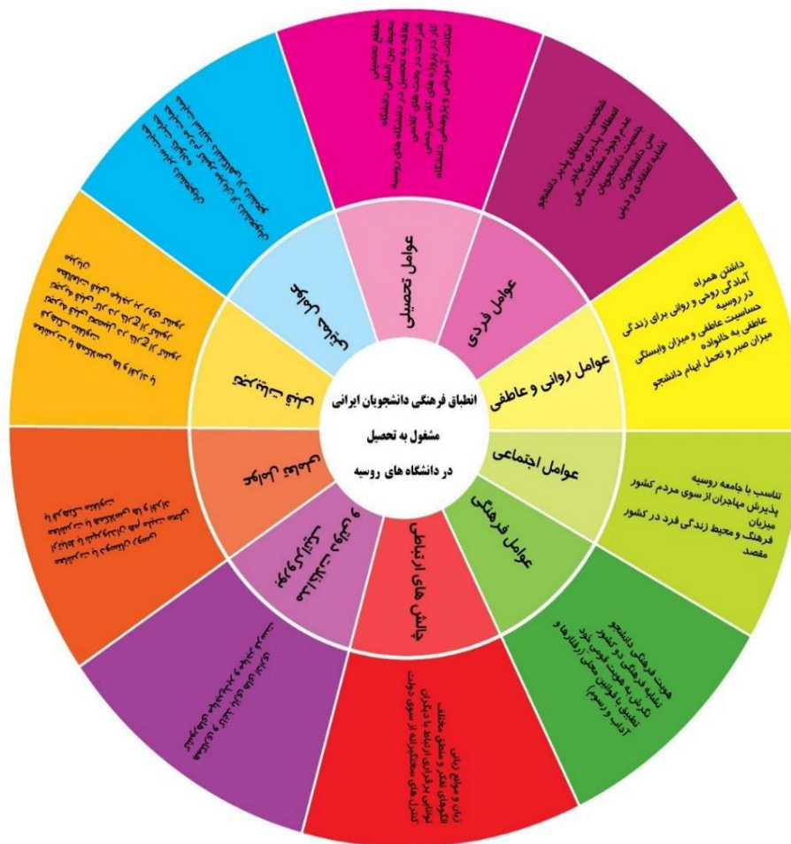
شکل ۱. مدل انطباق فرهنگی دانشجویان ایرانی مشغول به تحصیل در دانشگاه های روسیه