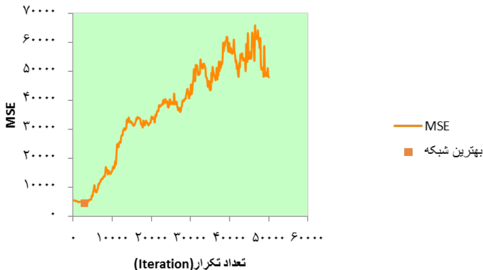
شکل ۳. مکانیزم تکرارهای صورت گرفته برای رسیدن به دقت بهینه

استفاده گردید. سنجش دقت روش شبکه عصبی مصنوعی چند لایه نشان داد که این روش دارای دقت ۹۰ درصد در پیش بینی تعداد مصدومین ارجاعی به پزشکی قانونی استان همدان است، که این نشان دهنده اعتبار بالای این روش جهت برآورد و تخمین روند در