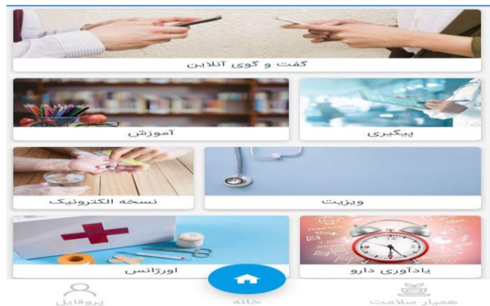
شکل ۱: صفحه اصلی سیستم پیگیری آموزش محور بیماران قلبی

بر اساس نتایج حاصل از نیازسنجی سیستم پیگیری آموزش محور بیماران قلبی بر پایه سلامت همراه طراحی و کد نویسی این برنامه با استفاده از زبان جاوا تحت سیستم عامل اندروید و با برنامه اندروید استودیو پیاده‌سازی گردید. این سیستم در یک نسخه طراحی شده است ولی کاربران بر اساس نقش (پزشک، بیمار و مدیر سیستم) با استفاده از