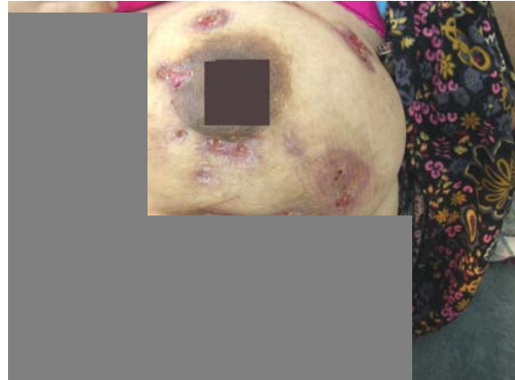
شکل ۲: زخم‌های متعدد ترشح‌دار در هنگام مراجعه

توجه و به‌خاطر داشتن این بیماری مهم است چراکه اغلب بیماران خانم‌های جوان و فعال هستند و اشتباه در تشخیص این بیماری می‌تواند عواقب اقتصادی، اجتماعی و روانی قابل توجهی داشته باشد. مشخص شدن علت، تشخیص زودهنگام و سریع و پروتکل درمانی معین و مناسب آن می‌تواند از پیامدهای ناگوار جلوگیری نماید. ۴