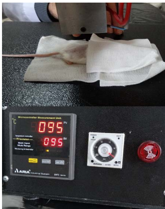
شکل ۱: روش ایجاد سوختگی درجه‌ی سوم در ناحیه‌ی پشتی موش سوری با دستگاه ویژه. دمای صفحه ۹۵ درجه‌ی سانتی‌گراد و مدت تماس صفحه‌ی داغ با پوست ۱۰ ثانیه بود.

برای تهیه‌ی ترکیب روغن زیتون و آب آهک به روش سنتی، ابتدا ۱۰۰ گرم آهک کاملاً خشک و بدون رطوبت در ۲۰۰ میلی‌لیتر آب حل شده و بعد از