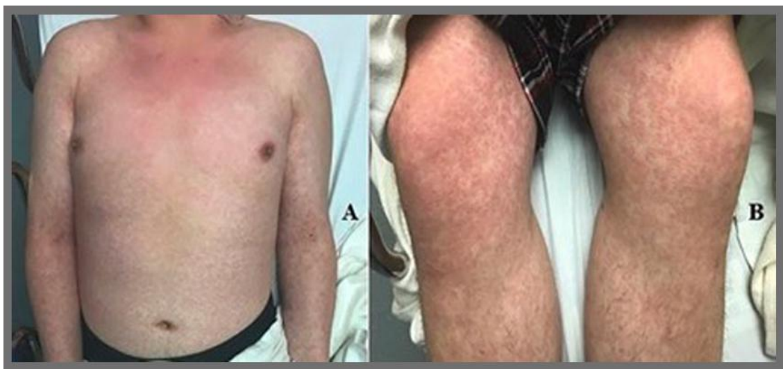
شکل ۱: راش گسترده ماکولوپاپولر در بیمار ۲۰ ساله

در ۱۷ مارچ ۲۰۲۰ یک مورد جالب در مجله‌ی JAAD گزارش شده که به بررسی یک بیمار تایلندی با تشخیص اولیه‌ی Dengue viral hemorrhagic fever پرداخته است. بیمار در ابتدا بدون تب و علائم تنفسی و تنها با راش پوستی همراه با پورپورا و پلاکت پایین به پزشک مراجعه می‌کند و با توجه به شیوع بالای تب