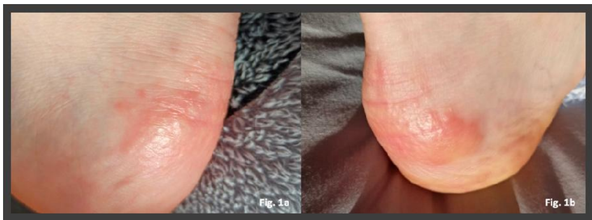
شکل ۳: پاپول‌های قرمز متمایل به زرد، ۱۳ روز پس از تشخیص کووید ۱۹

تا کنون براساس آمار ذکرشده، شیوع بیماری کووید ۱۹ در افراد زیر ۱۹ سال تنها ۲٪ گزارش شده که ۹۰٪ از آن‌ها با علائم بسیار خفیف یا به‌طور کلی