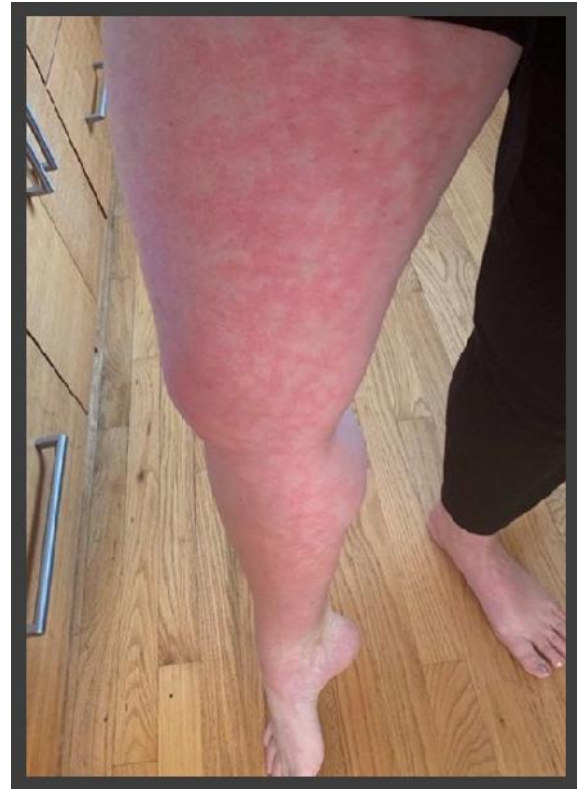
شکل ۵: ضایعات لیودورتیکولاریس

با در نظرگیری این مطالعه و گزارشات قبلی می‌توان ایسکمی نواحی اکرال را تظاهر نادری از بیماری کووید ۱۹ دانست و متخصصان درماتولوژی به‌عنوان خط اول مواجهه با بیمارانی با این تظاهرات پوستی، باید همواره بیماری کووید ۱۹ را در نظر داشته باشند ۱۵ .