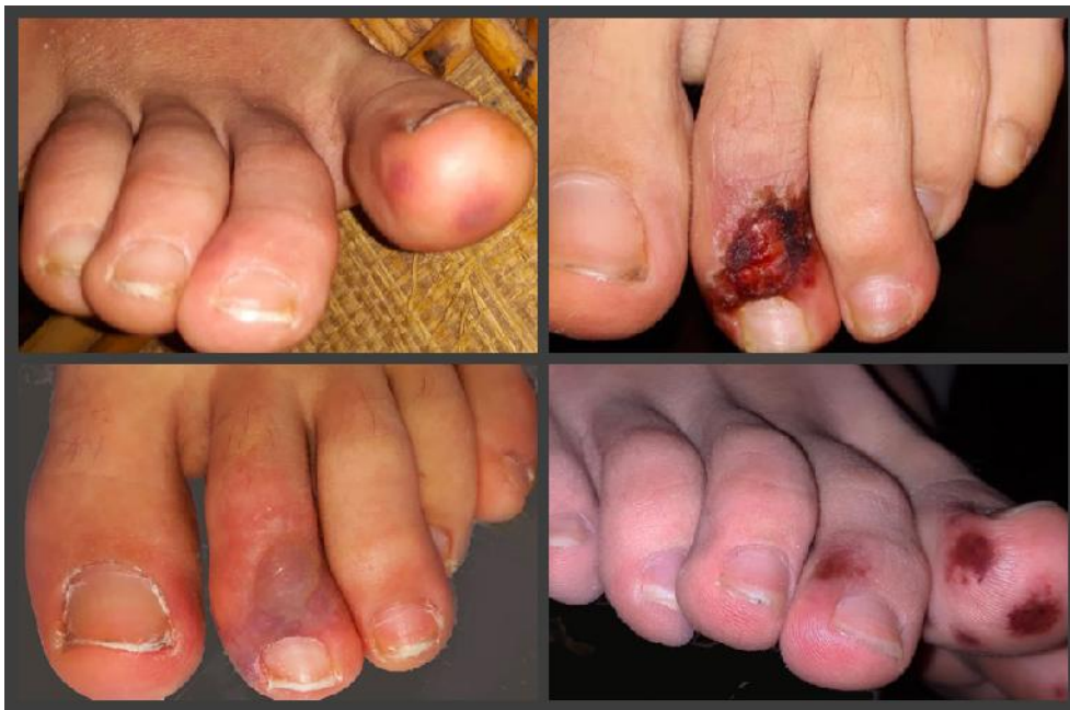
شکل ۶: ضایعات عروقی در انتهاها در بیماران کووید ۱۹

از نظر کووید ۱۹ انجام نشده اما همزمانی گسترش این تظاهرات پوستی در سراسر جهان و همه‌گیری جهانی