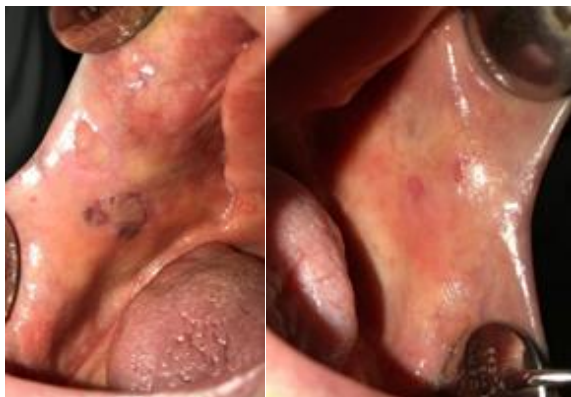
شکل ۱: زخم‌ها و اروژن‌های متعدد در مخاط باکال.