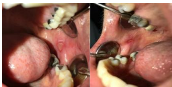
شکل ۲: زخم‌های دوطرفه.

و کاهش تعداد کلنی نسبت به گروه مواجهه با نیستاتین نیز دیده شد ( P < 0/001 ) (شکل ۳). در گونه‌های مقاوم لیزرخورده با ۸۱۰ نانومتر، تعداد کلونی‌ها به‌طور معنی‌داری کاهش و تقریباً به نصف رسیده بود ( P < 0/001 ) و کاهش تعداد کلنی نسبت به گروه مواجهه با نیستاتین نیز دیده شد ( P < 0/001 ) (جدول ۱). گروه کنترل مثبت پلیت حاوی ک.آلبیکنس استاندارد بدون مواجهه با لیزر و نیستاتین بود و گروه کنترل منفی فقط شامل محیط کشت بود (جدول ۱). نتایج تست‌های حساسیت دارویی هیچ