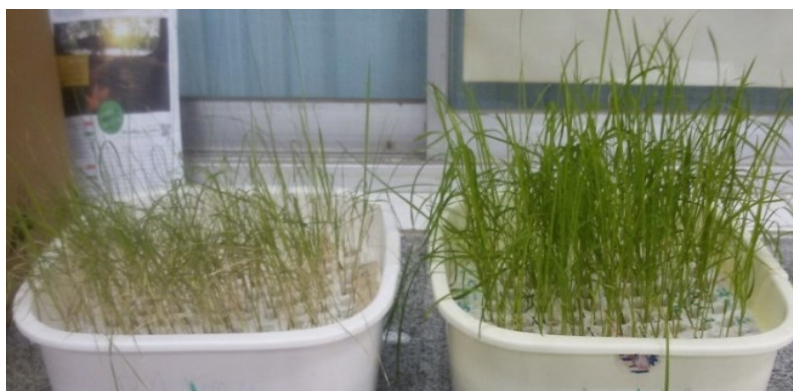
شکل ۱- گیاهچه‌های لاین‌های برنج در شرایط نرمال (راست) و تحت تنش شوری با EC=12dS.m^{-1} (چپ).

به منظور بررسی واکنش ۷۴ لاین خالص نوترکیب نسل هشتم برنج حاصل از تلاقی ارقام اهلمی طارم × ندا به تنش شوری، آزمایشی به‌صورت مرکب و در قالب طرح کاملاً تصادفی با سه تکرار، در دو شرایط کشت نرمال و شوری حاصل از NaCl، در آزمایشگاه گیاه‌شناسی دانشکده کشاورزی دانشگاه گنبد کاووس در سال ۱۳۹۵ اجرا شد. برای کشت، بر اساس دستورالعمل موسسه بین‌المللی برنج (Gregorio, 1997)، از صفحات یونولیت با ابعاد ۱/۲۵×۳۲×۲۸ و ظروف پلاستیکی هشت لیتری ضدعفونی شده، استفاده شد. ابتدا بذرهای به‌مدت چهار روز در دمای ۲۵ درجه سانتی‌گراد در