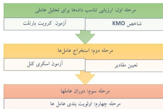
شکل ۱- مراحل انجام تحلیل عاملی

که در آن: W بیانگر ضرایب نمره عوامل و P معرف تعداد متغیرهاست. مبانی ریاضی تحلیل عاملی، برحسب مقدار و نوع واریانس هر متغیر X_i که توسط عامل‌های موجود در مدل توجیه می‌شود، متفاوت است (اصفهانی، ۱۳۹۶).