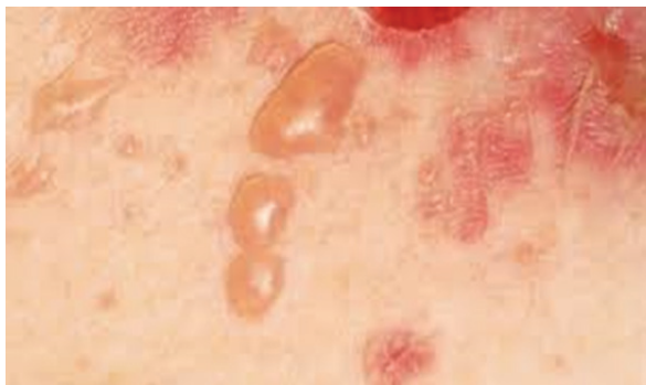
شکل ۱: ضایعات تاولی پوستی در بیماری مزمن پمفیگوس ولگاریس

وعدم وجودتحقیق مشابه در این زمینه بررسی تاثیر فعالیت ورزشی اوقات فراغت بر بیماری پمفیگوس و کیفیت زندگی بیماران ضرورت دارد. بنابراین در این مطالعه، هدف بررسی اثرات فعالیت های ورزشی اوقات فراغت بر کیفیت زندگی و علائم بالینی بیماران پمفیگوس ولگاریس می باشد. امید است نتایج حاصل از این پژوهش بتواند دریچه ی تازه ای برای برنامه ریزی فعالیتهای ورزشی در اوقات فراغت برای بیماران پمفیگوس باشد.