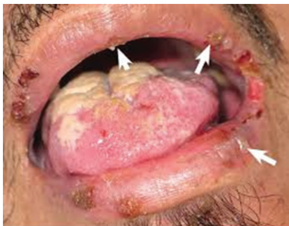
شکل ۲: ضایعات تاولهای مخاطی دردناک پمفیگوس ولگاریس