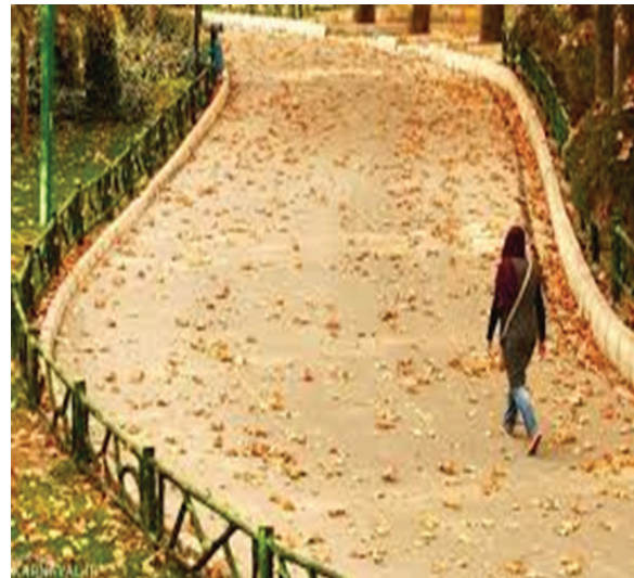
شکل ۴: پیاده روی غیر گروهی در پارک بعنوان فعالیت بدنی اوقات فراغت برای بیماران پمفیگوس ولگاریس