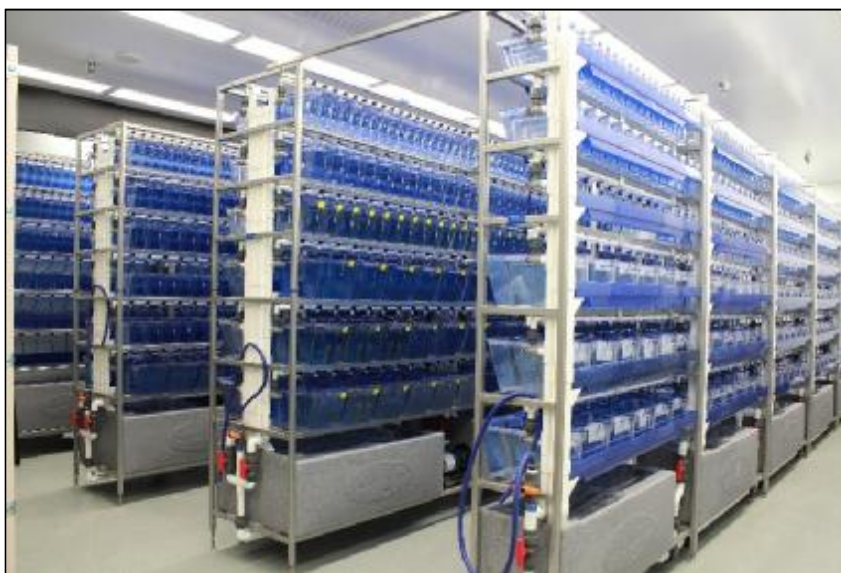
تصویر شماره‌ی ۴- لابراتوار اختصاصی تولید ماهی گورخری دانشگاه دالهاوزی کانادا، آزمایشگاه دکتر برمن.

گورخری، به تولید به‌موقع و مداوم تخم و جنین با کیفیت بالا برای آزمایش بستگی دارد. درک رفتارهای تولید مثل ماهی در حیات‌وحش و به تبع آن در محیط اسارت، نوآوری‌هایی را در تکنیک‌های پرورش و تجهیز ادوات آزمایشگاهی موجب شده است (۵۰). یک نمونه‌ی شایسته‌ی توجه از این ادوات آزمایشگاهی پیشرفته، استفاده از مخازن تخم‌ریزی iSpawn است که در حال حاضر در کشور وارد نشده اما امکان واردات و حتی تولید آن توسط متخصصان داخلی به‌راحتی ممکن است. این مخازن برای تخم‌ریزی ماهی گورخری طراحی و تولید شده است و امروزه به‌صورت تجاری شده در اقصا نقاط