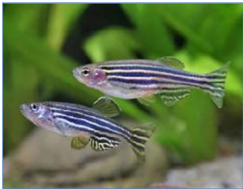
تصویر شماره ۱- ماهی گورخری برگرفته از

شیرین جهان دارد و به خوبی در صنعت آکواریوم و ماهیان زینتی اقصا نقاط جهان وارد شده است. از این ماهی برای کنترل بیولوژیک پشه در برخی نقاط دنیا (۲۵)، در صنعت آکواریوم و ماهیان زینتی (۲۶) و خصوصاً به عنوان یک گونه زیستی مدل ۶ در توسعه علوم مختلف زیست‌شناسی (۲۷ و ۲۸) استفاده می‌شود. به طور کلی ماهیان گورخری از زمان خروج از تخم (مرحله‌ی هچ شدن یا تخم‌گشایی) تا ۲۱ روز پس از آن مرحله‌ی نوزادی (ماهی نوزاد) ۷ ، از روز بیست و یکم تا نودمین روز مرحله‌ی جوانی (ماهی جوان) ۸ و پس از نود روز مرحله‌ی بلوغ (ماهی بالغ) ۹ را طی می‌کنند (۲۹).