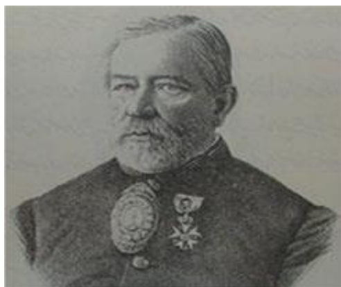
دکتر ژوزف دزیره طولوزان