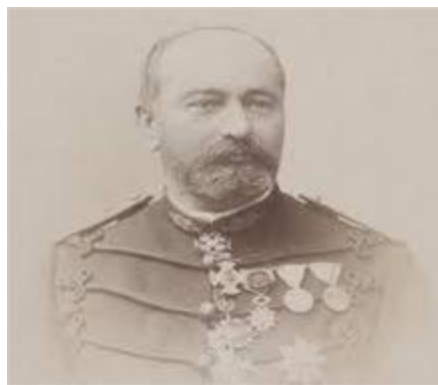
دکتر ژان باتیست فوریه