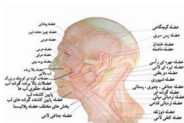
تصویر شماره ۲- انواع عضلات سر و صورت

نوع عضلات، شرکت در حرکات بدن است. انقباض این عضلات، سریع و قدرتمند است و معمولاً، تحت کنترل ارادی اند (۴۸). هر یک از عضلات اسکلتی، به تناسب جایگاه یا کارکردی که دارند، عنوانی خاص گرفته‌اند. در تصویر زیر، انواع عضلات سر و صورت، با عناوین خاص آن‌ها، دیده می‌شود؛ البته در این تصویر، برخی از عضلات گردن نیز، نمایش داده شده‌اند. عضلات گردن، بستر اصلی شجاج نیستند و مشمول عضلات سر و صورت نمی‌شوند: