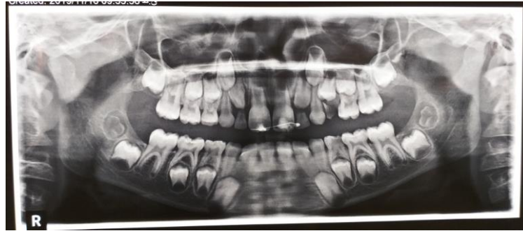
شکل ۲: کلیشه‌ی پانورامیک بیمار پس از تروما