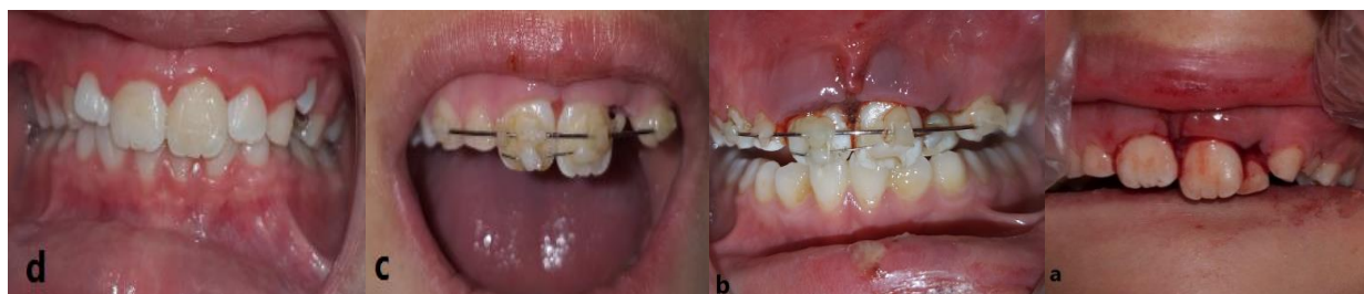
شکل ۱: a: نمای کلینیکی پس از تروما نشان‌دهنده‌ی اکستروژن دندان #۹ b: نمای داخل دهانی پس از اسپلینت، c: پس از ۲ هفته، d: پس از ۳ ماه

پسری ۸ ساله به مرکز اورژانس دانشکده‌ی دندان پزشکی دانشگاه علوم پزشکی قزوین مراجعه نمود. وی دچار ترومای دندانی به دلیل تماس با جدول شده بود. پس از اخذ تاریخچه از بیمار، در طی معاینه بافت نرم دهان ابریژن لب بالا و پایین و چانه و پارگی فرنوم لب بالا مشاهده شد. در بررسی بافت‌های سخت دهان و صورت بیمار هیچگونه جابه‌جایی در کندیل مشاهده نشد و مشخص شد که دندان #۹ به میزان ۵ میلی‌متر اکستروژد شده و دندان #۸ دچار آسیب Subluxation شده بود (شکل ۱-ا و شکل ۲).