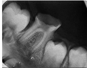
شکل ۱: مولر اول سمت راست

گردید. کانال‌های مزیالی با گوتاپرکا شماره‌ی ۲۵ با تیپر ۲ درصد پر شدند. سیلر مورد استفاده (Dentsply AH-26) (Maillifer, Switzerland) بود. سپس گلاس آینومر نوری (GC, Japan) بر روی کانال‌ها در حفره‌ی دسترسی قرار داده شد و دندان تحت درمان با Stainless Steel Crown (MIB, South Korea) شماره‌ی ۴ با استفاده از گلاس آینومر سلف کیور (GC, Japan) قرار گرفت.