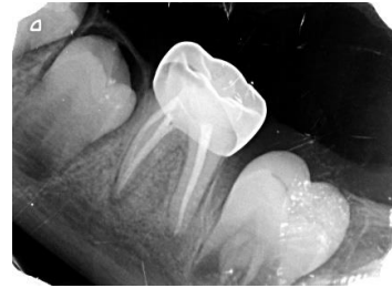
شکل ۵: پیگیری ۶ ماهه