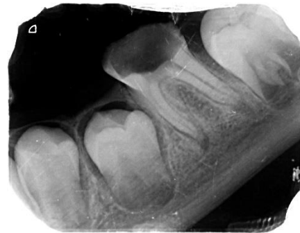
شکل ۲: مولر اول سمت چپ

در جلسه‌ی سوم بی‌حسی موضعی سمت چپ پایین با روش قبلی به دست آمد و دندان مولر اول دائمی با رابردم ایزوله گردید و حفره‌ی دسترسی تهیه شد. دندان دارای ۵ کانال شامل سه کانال مزیالی و دو کانال دیستالی بود. آماده‌سازی ریشه‌ی دندان مانند جلسه‌ی اول بود. به علت عدم وجود ضایعه در رادیوگرافی اولیه، در یک سوم اپیکال کانال‌های دیستالی سرامیک سرد (سرو جاوید مدرس، ایران) طبق دستور کارخانه‌ی سازنده قرار گرفت و پس از ۱۵ دقیقه که زمان ست شدن اولیه‌ی این دندان است، مابقی کانال‌ها با گوتا پرکا پر شد. کانال‌های مزیالی با گوتا پرکا شماره‌ی ۲۵ با تیپر ۲ درصد پر شدند. سپس گلاس آینومر نوری بر روی کانال‌ها در حفره‌ی دسترسی قرار داده شد و دندان تحت درمان با SSC شماره‌ی ۴ با استفاده از گلاس آینومر سلف کیور قرار گرفت.