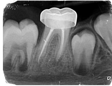
شکل ۴: پیگیری ۱۲ ماهه

در این گزارش مورد با توجه به اینکه هر دو دندان مولر اول دائمی پایین نکرورز بودند و آپکس ریشه‌های دیستالی آن‌ها باز بود، تصمیم به درمان اپکسیفیکاسیون در ریشه‌های دیستال و درمان اندو در ریشه‌های مزایل گرفتیم. از ویژگی‌های این گزارش مورد این است که در یک بیمار با