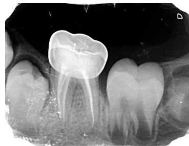
شکل ۶: پیگیری ۱۲ ماهه

مقاله‌ی حاضر حاصل طرح پژوهشی به شماره‌ی ۵۴۷۵۹ و دارای کد اخلاق به شماره‌ی IR.MUI.RESEARCH.REC.1399.825 می‌باشد.