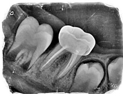
شکل ۳: پیگیری ۶ ماهه

در پیگیری ۶ و ۱۲ ماه دندان تحت درمان با MTA، علائم کلینیکی مشاهده نشد و در پیگیری رادیوگرافی بعد از ۱۲ ماه، ضایعه در ریشه‌ی مزیالی دندان مولر سمت راست بهبود یافت (شکل ۳، ۴). در پیگیری ۶ و ۱۲ ماهه، دندان تحت درمان با سرامیک سرد فاقد علائم کلینیکی و رادیوگرافی بود (شکل ۵، ۶).