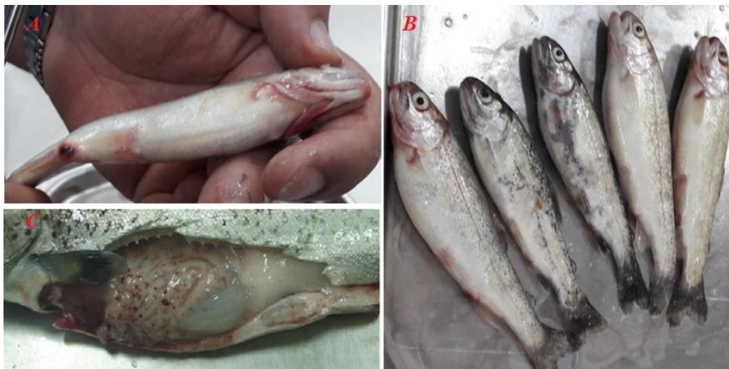
شکل ۱- یافته‌های معاینه درمانگاهی و کالبدگشایی ماهیان تلقیح شده با Y. ruckeri ؛ تصویر (A) همورازی و زخم در مخرج و فک زیرین، (B) سیاه شدگی جزئی و خونریزی سرسوزنی اطراف باله سینه‌ای، (C) خون‌ریزی سرسوزنی روی پیلوریک سکا