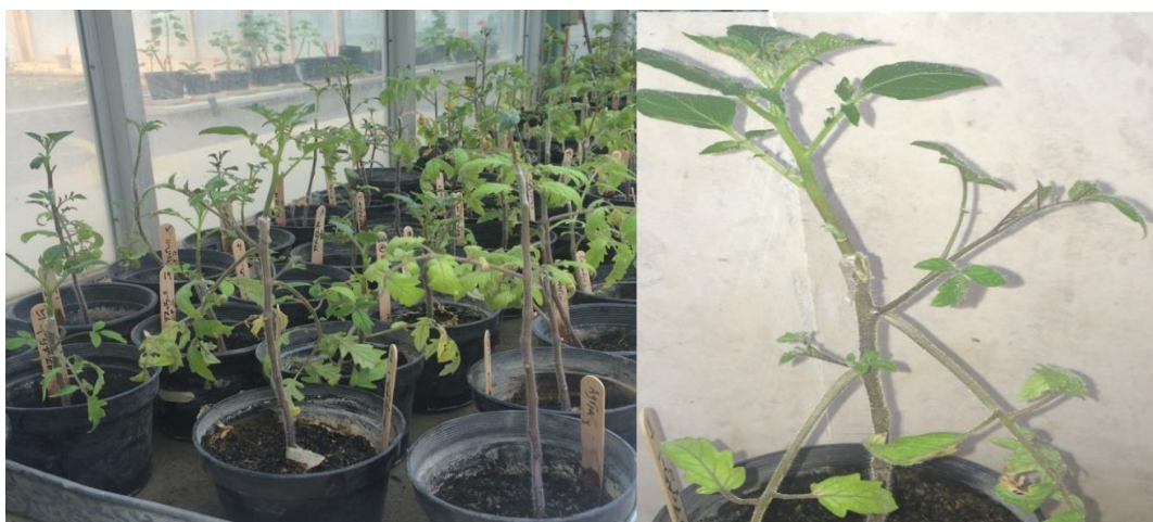
شکل ۱- پیوند اسکنه‌ای ژنوتیپ‌های سیب‌زمینی روی پایه گوجه فرنگی رقم روتگرز آلوده به PVX Fig. 1. Grafting potato genotypes' scions on tomato cv. Rutgers rootstocks infected with PVX

برگ‌های گیاهان آزمایشی را توسط پودر کربوراندوم ۶۰۰ mesh غبار پاشی کرده و با مالش دادن ۲-۳ برگچه از هر گیاه توسط پارچه ممل آغشته به سوسپانسیون ویروس، مایه‌زنی انجام شد. برای اطمینان ۴۸ ساعت بعد مایه‌زنی مجدداً تکرار شد. در این آزمایش رقم وایت لیدی (White Lady) به عنوان شاهد مقاوم و رقم هرمس (Hermes) به عنوان شاهد حساس در نظر گرفته شد. حدود ۲۵ روز بعد از مایه‌زنی، آلودگی هر یک از گیاهان با استفاده از تست DAS-ELISA مورد ارزیابی قرار گرفت و در صورت آلودگی