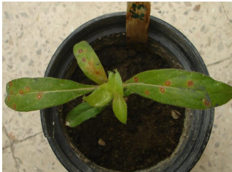
تصویر ۲ - علائم لکه موضعی ناشی از PVX روی گیاه محک گل تکمه‌ای