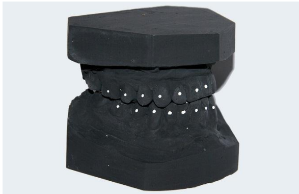
شکل ۱. تصویر فتوگرافیک مدل با نقاط FA تعیین شده بر روی تمام دندان های دائمی با در نظر گرفتن نقطه FA مولرهای اول به عنوان مرجع

۱۹) عمق بین مولری (IMD): فاصله بین تماس ثنائی سائترال و خطی که نقاط FA مولرهای اول را به هم متصل می‌کند.