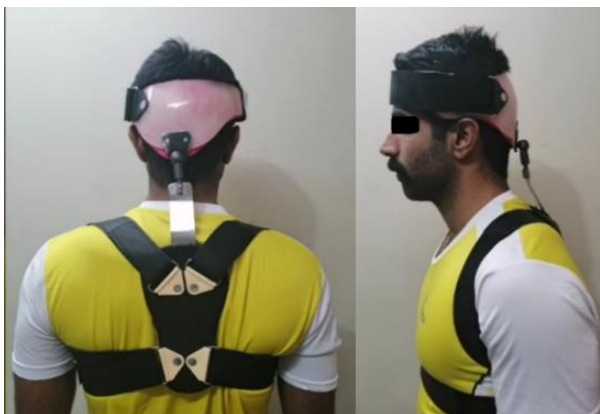
شکل ۱. ارتز FHRSO بکارگرفته شده در این تحقیق

طراحی ارتز. ارتز طراحی شده در مطالعه‌ی حاضر، FHRSO، نام‌گذاری شد. قطعات تشکیل‌دهنده‌ی این ارتز، عبارت بودند از، یک پد پس سری در ناحیه اکسیپوت، یک استرپ متصل به پیشانی، دو استرپ کشسان دور شانه‌ها (جهت اعمال نیروی ریتراکشن در شانه‌ها) و هم‌چنین یک پد بین دو کتف متصل به یک تسمه فتری (شکل ۱).