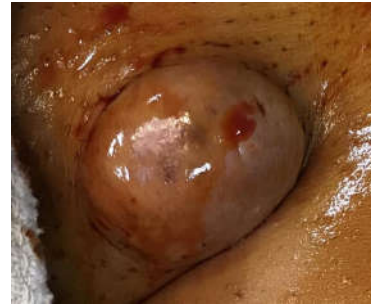
شکل ۱: توده نسج نرم واقع در ناحیه اینگوینال چپ و مونس پوبیس