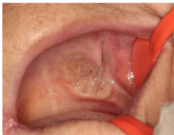
شکل ۱: نمای بالینی ضایعه اندوفیتیک با سطح ناصاف و در بعضی نواحی زخم با غشای فیبرینولوکوسیت

در گزارش موردهای مربوط به سروگردن، ۹۰٪ لنفومهای نان هوچکین در سینوس گزارش شده که اکثرا از نوع سلولهای B بودند. ۱۱ در بیمار گزارش شده در این مقاله، اولین تظاهرات متاستاز