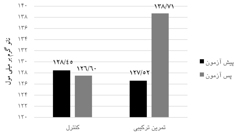
نمودار ۳. نتایج IGF-1 بین گروهی