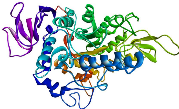
شکل ۱- ساختار سه بعدی (3D) آنزیم آلفاگلوکوزیداز با کد PDB:3a4a.