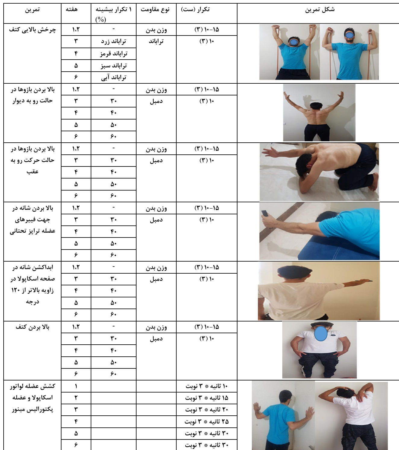
جدول ۱- پروتکل تمرینات اصلاحی کتف در طی شش هفته در افراد دارای نقص چرخش پایینی کتف