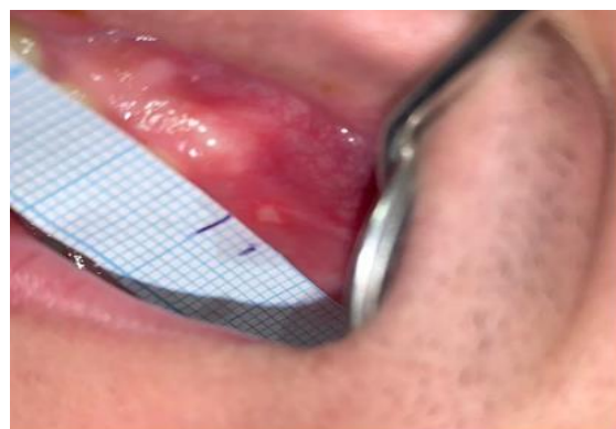
تصویر ۱: نحوه اندازه گیری زخم آفتی

اندازه ضایعه براساس بیشترین قطر زخم به روش قرار دادن کاغذ شطرنجی یک میلیمتری (خط کش های کاغذی شفاف که به صورت واحدهای ۱ میلیمتری مشخص شده بودند و یکبار مصرف بودند) تعیین قطر شد. (تصویر ۱) میزان درد و سوزش بیمار بر حسب VAS (Visual Analogue Scale) که یک پاره خط صد میلیمتری است، مورد ارزیابی قرار گرفت. صفر به معنای بدون درد و صد نشان دهنده بیشترین دردی بود که بیمار در طول عمر تجربه کرده بود. (۱۰)