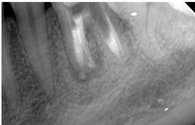
تصویر ۲: رادیوگرافی پس از درمان با زاویه دیستالی (مقداری از سرامیک سرد از اپیکال خارج شده و وارد فضای پری اپیکال گردید.