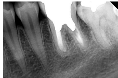
تصویر ۴: فالو آپ ۲ ساله پس از درمان دندان (سرامیک سرد موجود در فضای پری اپیکال جذب گردید و ضایعه کاملاً بهبود پیدا کرد)

در مورد پر کردن کانال ریشه تامین سیل اپیکالی مناسب یکی از مهمترین عوامل موفقیت درمان ریشه ی دندان است. ماده مورد استفاده باید در زمان کوتاه سخت شود و زیست سازگاری مناسبی داشته باشد. (۳) سرامیک سرد با توجه به زمان سخت شدن کوتاه آن، قابلیت سخت شدن در محیط مرطوب و آلوده به خون و همچنین زیست سازگاری آن، برای موارد درمانی با تامین سیل اپیکالی دشوار، مناسب است. در مطالعه ای که توسط مختاری و همکاران (۷) با هدف بررسی قدرت سیل کنندگی سرامیک سرد و مقایسه با MTA انجام شد، به این نتیجه رسیدند که قدرت سیل کنندگی سرامیک سرد در محیط آلوده به خون نسبت به MTA بیشتر میباشد و در محیط خشک و مرطوب نیز قدرت سیل کنندگی آن تفاوتی با MTA ندارد. همچنین تطابق مارژینال سرامیک سرد در طولانی مدت نسبت به MTA بیشتر نشان داده شد. علاوه بر این طی مطالعه ای که توسط مدرسی و همکاران (۱۱) انجام شد گزارش مورد موفقی از اپکسیفیکاسیون و پر کردن کانال ریشه دندان سانترال سمت راست ماگزیلای کودکی ده ساله ارائه شد که در جلسات پیگیری یک و دو ساله، بهبود علائم بالینی ضایعه و تشکیل لیگمان پرپودنتال جدید و بازسازی استخوان تحلیل رفته