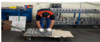
تصویر ۴. بارگیری بر روی پالت در زیر وظیفه بسته‌بندی