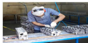
تصویر ۱. عملیات فرزنی در زیروظیفه پلیسه‌گیری