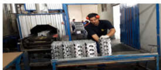
تصویر ۲. تخلیه بعد از شستشو در زیروظیفه شستشو

نمونه‌ای از وضعیت بدن کارگران در ایستگاه کار در تصاویر ۱ تا ۴ ارائه شده است.