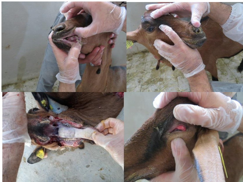
Figure 2. Clinical signs of animals naturally infected with PPRV. The oculo-nasal discharges, crust on the lips, Oral lesions with rough necrosis on the lower gum.

از مجموع ۸۵۴ رأس نشخوارکننده‌ی کوچکی که در سه منطقه میم و قمرود و همچنین گله‌ی بز نژاد سانن و آلباین در منطقه زنبورک استان قم که با گزارش بیماری طاعون نشخوارکنندگان کوچک در این تحقیق مورد بررسی قرار