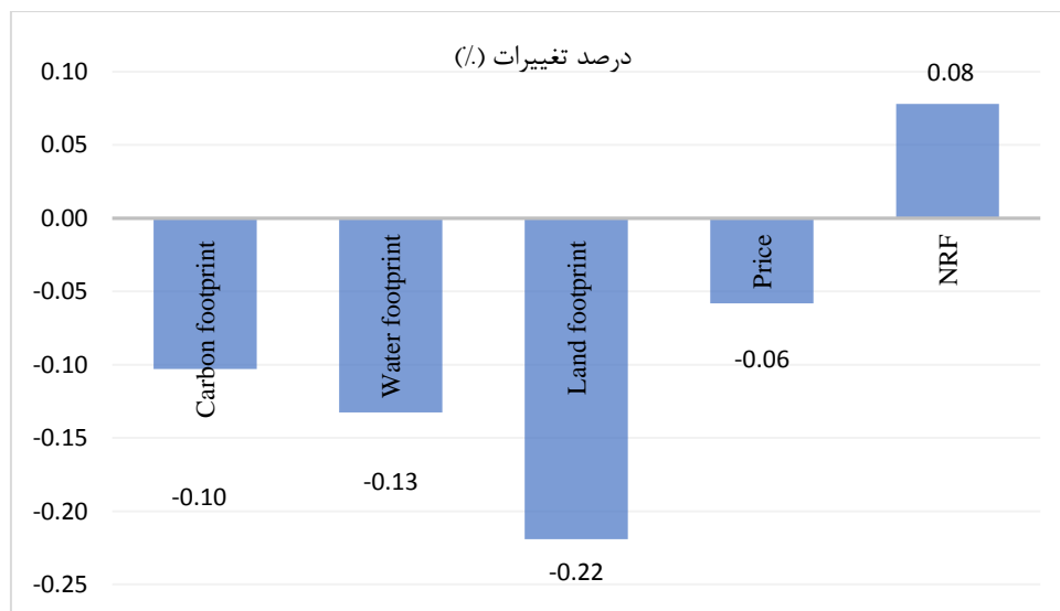
نمودار ۱. درصد تغییرات ردپای کربن، آب کل، زمین، هزینه و شاخص تغذیه ای در صورت جایگزینی منوی غذایی یک ارائه شده در سلف سرویس دانشکده با منوی غذایی پایدار