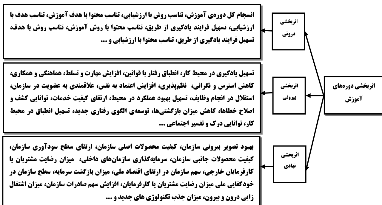
شکل شماره ۲: چارچوب مفهومی سه بعدی اثربخشی درونی، بیرونی، نهادی (ترک‌زاده و همکاران، ۱۳۹۳)

تحقق فلسفه‌ی وجودی فعالیت مورد نظر را اثربخشی نهادی می‌نامند که در سطح کلان مطرح می‌شود (ترک‌زاده، ۱۳۸۸).